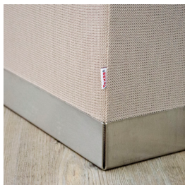
Bac en acier inoxydable brossé