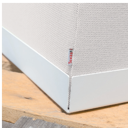
Bac en acier laqué blanc