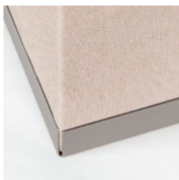
Bac en acier laqué gris