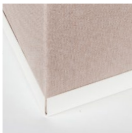
Bac en acier laqué blanc