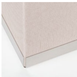
Bac en acier inoxydable brossé