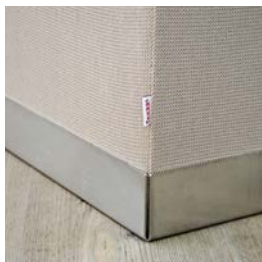
Bac en acier inoxydable brossé