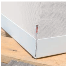
Bac en acier laqué blanc